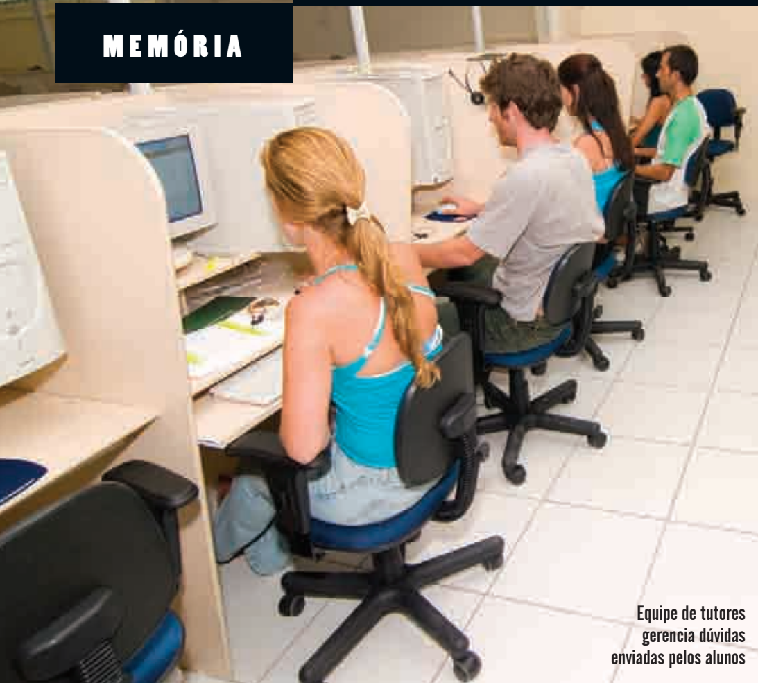
Equipe de tutores gerencia dúvidas enviadas pelos alunos